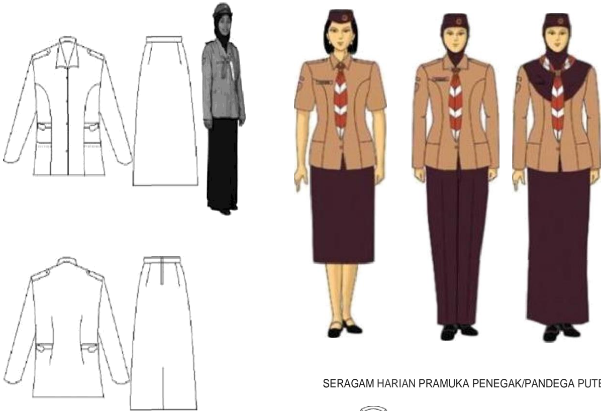
SERAGAM HARIAN PRAMUKA PENEGAK/PANDEGA PUTERA